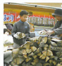
まちなかイベント(秋) 森林の恵みフォーラム/10月上旬