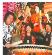
くずまき秋まつり /9月下旬