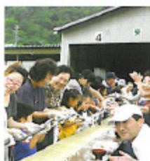
まちなかイベント(夏) /8月上旬