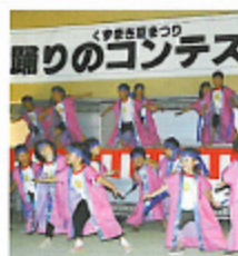
くずまき夏まつり /8月中旬